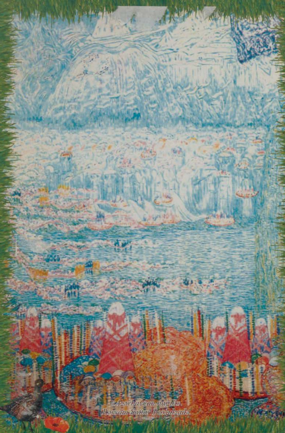
«Azərbaycan nağılı» Rəssam Sait Bəxtulzadə