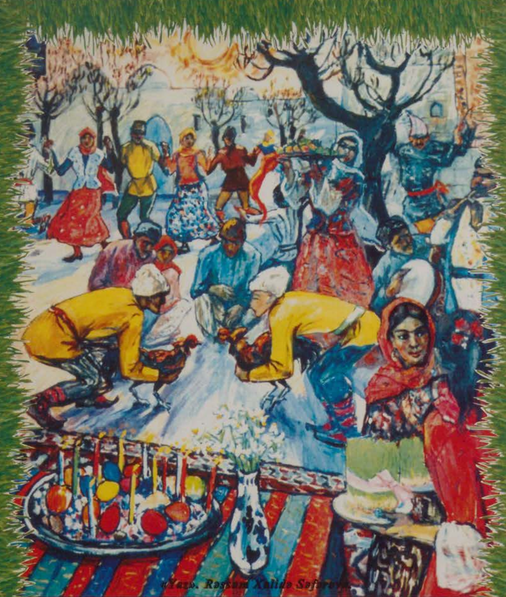
«Yar». Rəşad Xəlilə Səfərov