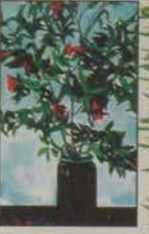
«Çiçəklənən nar». Rəssam Tahir Salahov.