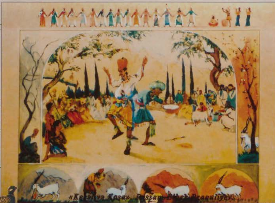
«Keçəl və Kosa», Rəssam Əli bəy Bəquliyev.

– Ay Kosa-Kosa, can Kosa, Sən tap gətir, yekə qaz. Onu yaxşı bişirək, Mən çox yeyim, sənsə az.